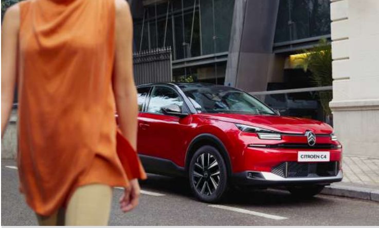
ELECTRONIC PARKING BRAKE