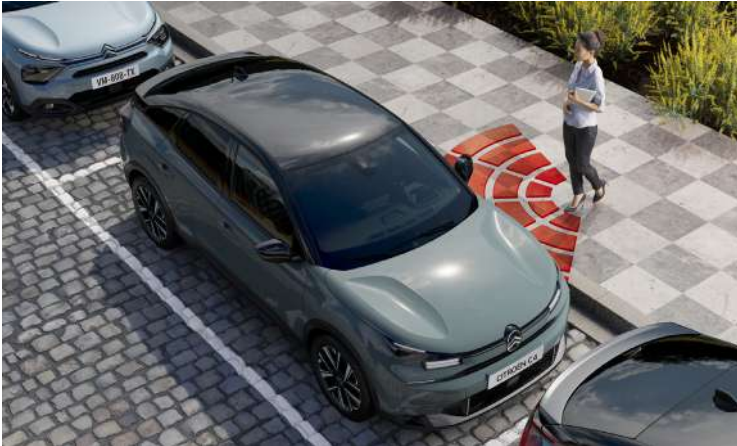
PROXIMITY KEYLESS ENTRY AND START

فتح و غلق السيارة أوتوماتيكياً عند القرب منها