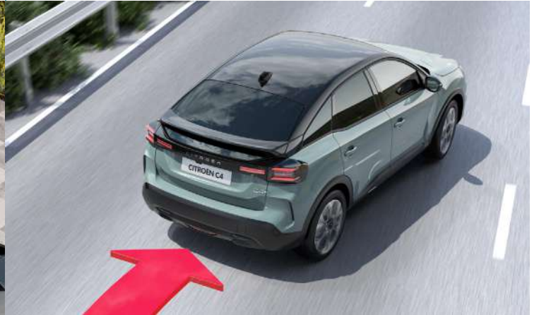
DRIVER ATTENTION SYSTEM

فتح و غلق السيارة أوتوماتيكياً عند القرب منها