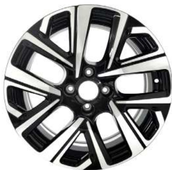
MARIEM ALLOY WHEEL 17INCH DIAMANT CUTTING